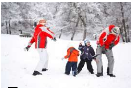
Прогулки на свежем воздухе