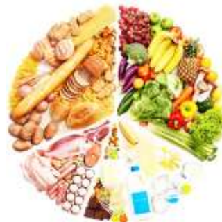
Правильное и здоровое питание